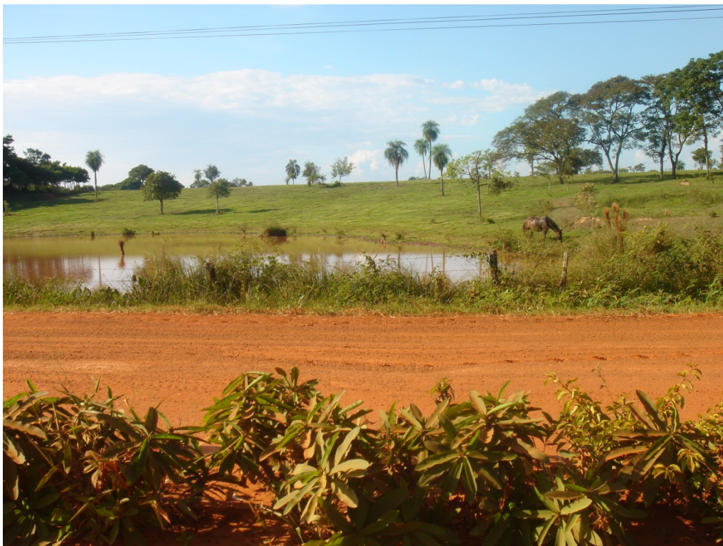
Camino de tierra